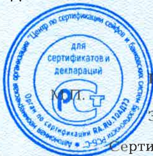
Схема сертификации - 3