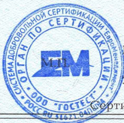
Схема сертификации 3с